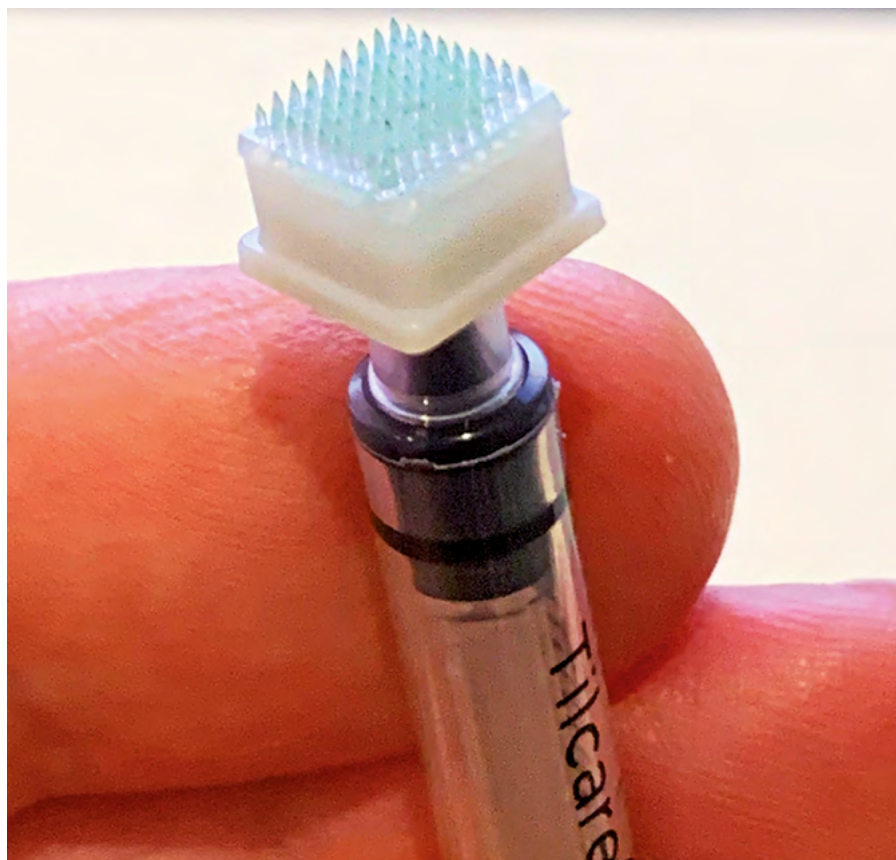
Obr. 3 Mikrojechličkový aplikátor

Novým přístupem je i mikrojechličkový aplikátor. Výzkumníci z Carnegie Mellon University College