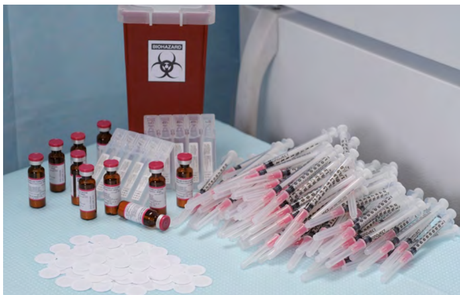
Obr. 2 Srovnání nutného materiálu pro aplikaci intramuskulární či subkutánní injekce a mikrojechličkové náplasti

Příkladem použití mikrojechličkových náplastí je studie s vakcínou proti chřipce. Do studie bylo zahrnuto 100 účastníků, kteří byli náhodně rozděleni do skupin. V souvislosti s aplikací se nevyskytly žádné závažné nežádoucí příhody. Mezi očkovacími skupinami (vakcína aplikována zdravotnickým pracovníkem mikrojechličkovou náplastí nebo intramuskulární injekcí nebo mikrojechličkovou náplastí aplikovanou samostatně subjektem hodnocení), byl celkový výskyt očekávaných nežádoucích účinků ( n = 89 vs. n = 73 vs. n = 73 ) a neočekávaných nežádoucích účinků ( n = 18 vs. n = 12 vs. n = 14 ) podobný. Reaktogenita byla mírná a přechodná a nejčastěji byla uváděna citlivost (15 [60 %] z 25 účastníků [95% CI: 39–79]) a bolest (11 [44 %] z 25 [24–65]) po intramuskulární injekci; citlivost (33 [66 %] z 50 [51–79]), erytém (20 [40 %] z 50 [26–55]) a pruritus (41 [82 %] z 50 [69–91]) po očkování aplikací mikrojechličkové náplasti. Geometrické průměrné titry byly 28. den mezi mikrojechličkovou náplastí podanou zdravotnickým pracovníkem a intramuskulární cestou pro kmen H1N1 (1197 [95% CI: 855–1675] oproti 997 [703–1415]; p = 0,5 ), kmen H3N2 (287 [192–430] vs. 223 [160–312]; p = 0,4 ) a kmen B (126 [86–184] vs. 94 [73–122]; p = 0,06 ). Podobné geometrické průměrné titry byly hlášeny u účastníků, kteří si sami aplikovali mikrojechlič-